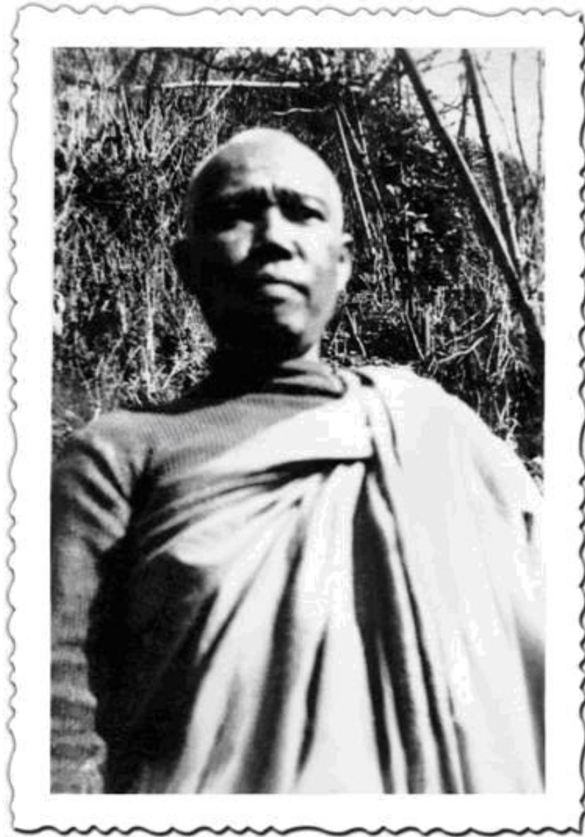
Nhãn Tế Thiên Sư tại xứ Tây Tạng