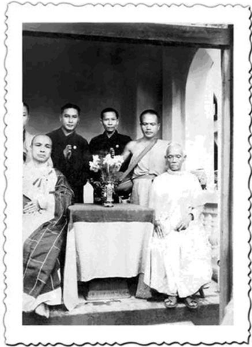
Tại Phật Bửu Tự, Saigon 29-04-1951