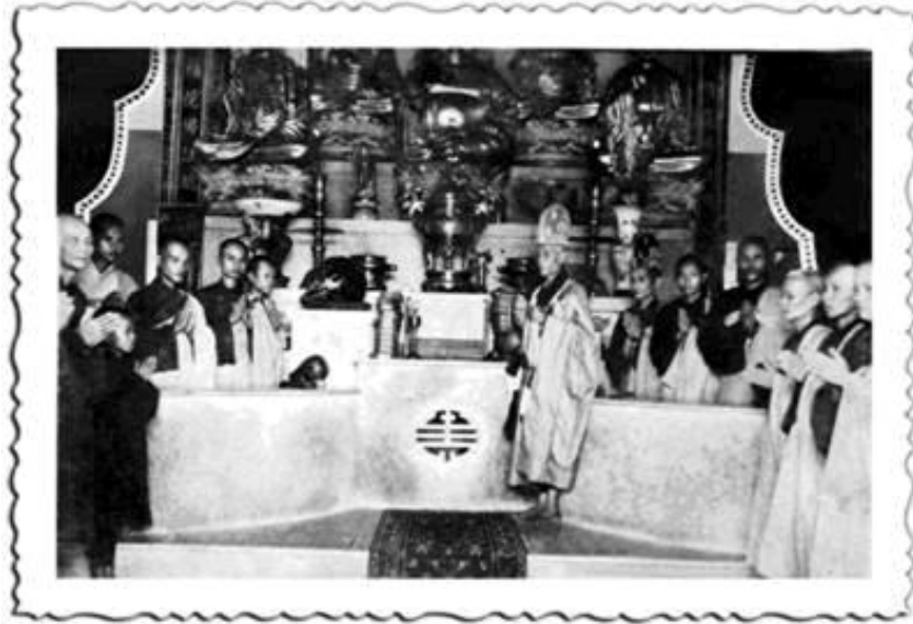
Đại chúng Thiên Chơn Tự