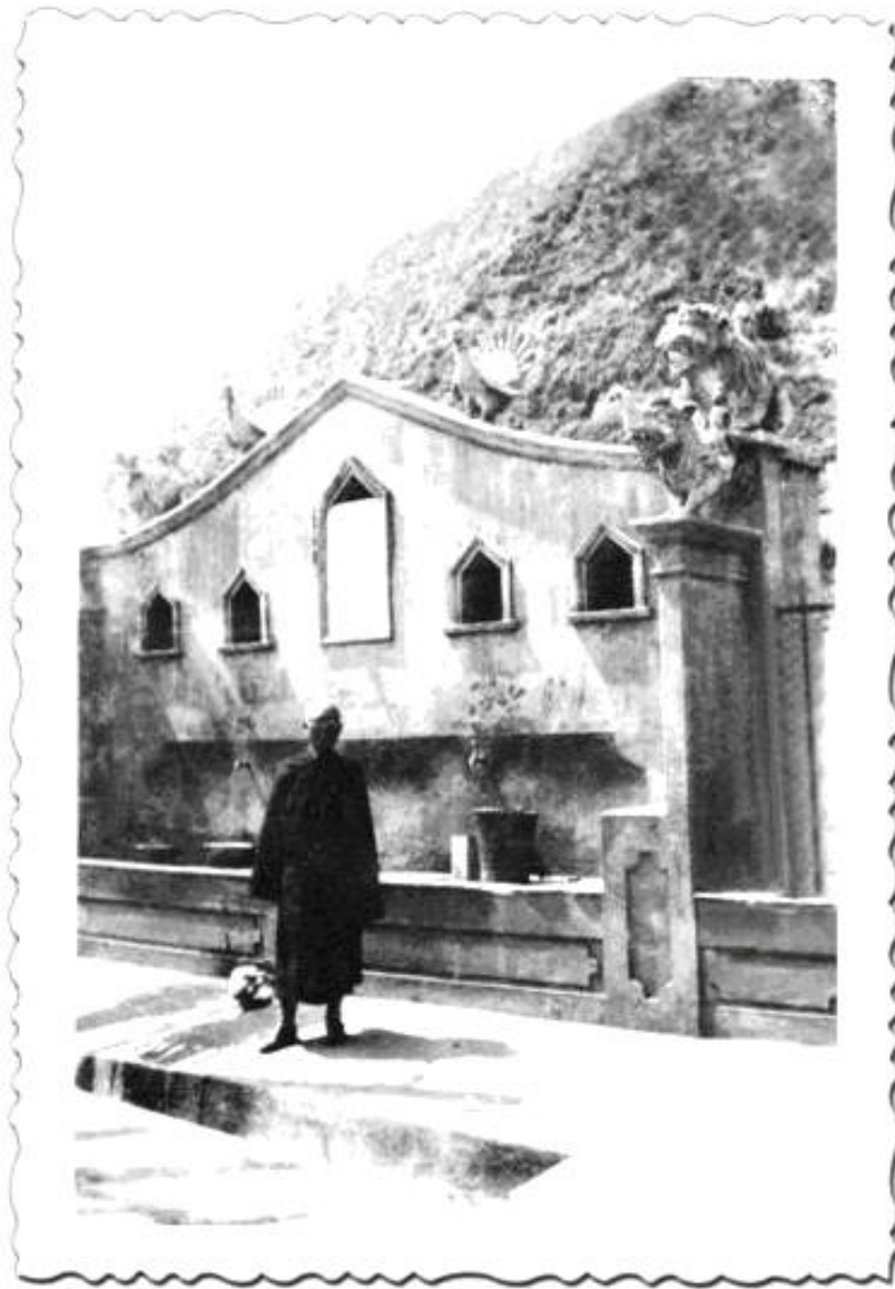
Nhãn Tế Thiên Sư tại thành Ghoom