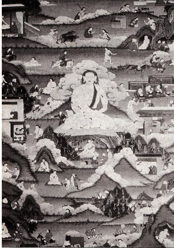
Những cảnh đời của Milarepa