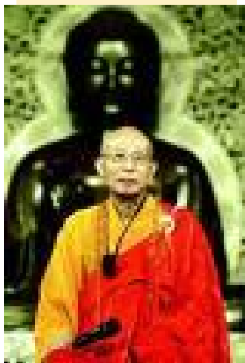
HT Thánh Nghiêm