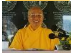
HT THANH TỪ